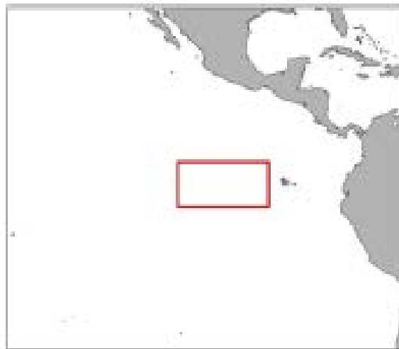
Figura 1. Área de veda